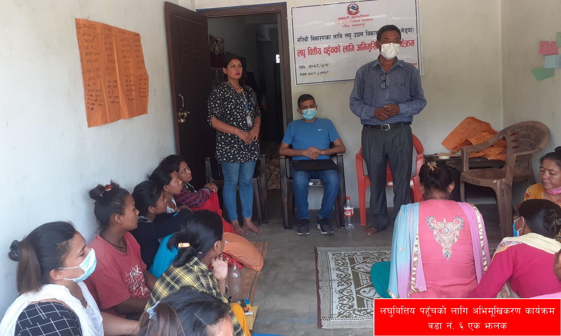
लघुवित्तीय पहुँचको लागि अभिमुखिकरण कार्यक्रम वडा नं. ६ एक भलक

मकवानपुर गाउँपालिका गाउँ कार्यपालिकाको कार्यालय रुवेया, मकवानपुर गरिबी निवारणका लागि लघु उद्यम विकास (मेडपा) लघु वित्तीय पहुँचको लागि अभिमुखिकरण कार्यक्रम मिति: २०७८/०३/१२ स्थान: भवने-६, सुकपुरी