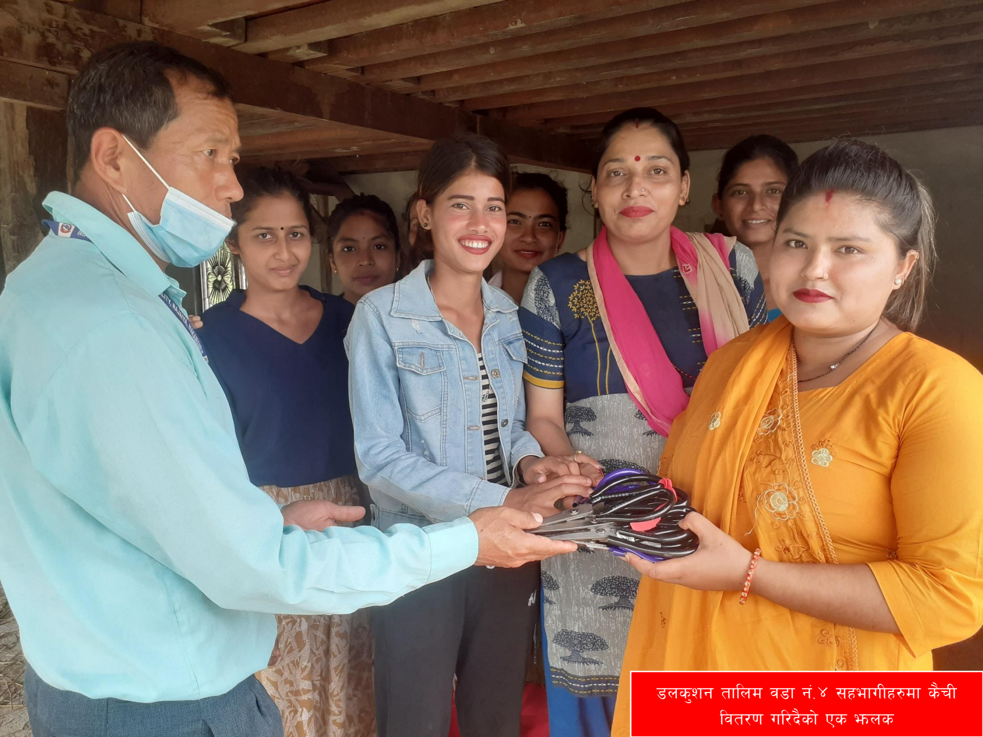
डलकुशन तालिम वडा नं.४ सहभागीहरुमा कैची वितरण गरिदैको एक भलक