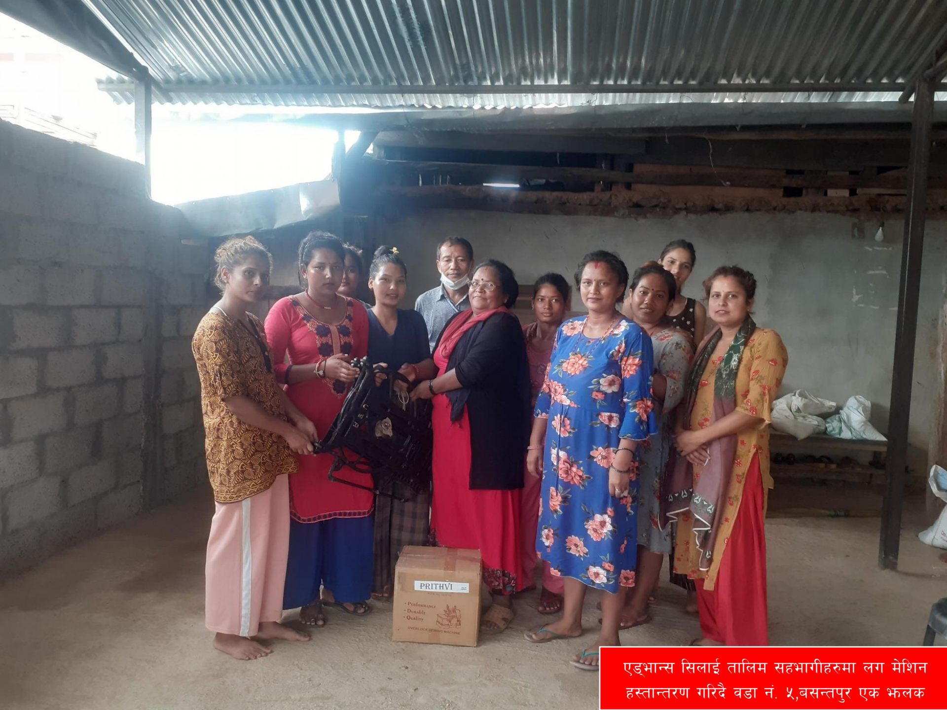
एड्भान्स सिलाई तालिम सहभागीहरुमा लग मेशिन हस्तान्तरण गरिदै वडा नं. ५, बसन्तपुर एक भलक